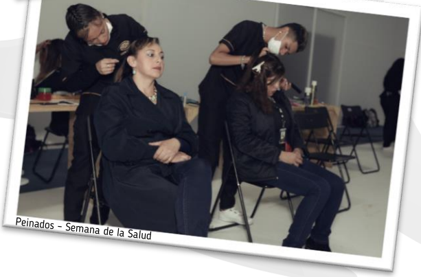
Peinados - Semana de la Salud