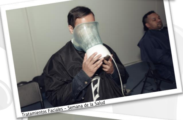
Tratamientos Faciales - Semana de la Salud