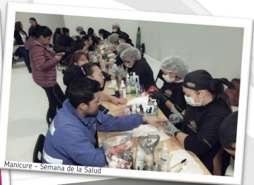
Manicure - Semana de la Salud