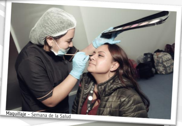
Maquillaje - Semana de la Salud

Con broche de oro la Coordinación de Talento Humano cerró la Semana de la Salud, fue un día en el que hombres y mujeres, tuvieron una pausa con actividades para el cuidado personal y su salud, dentro de las que encontramos: cortes de cabello y barba, Manicure, tratamientos faciales, maquillaje, peinados y una clase magistral de zumba.