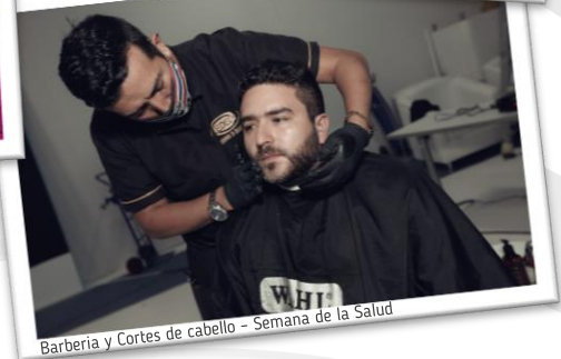
Barbería y Cortes de cabello - Semana de la Salud