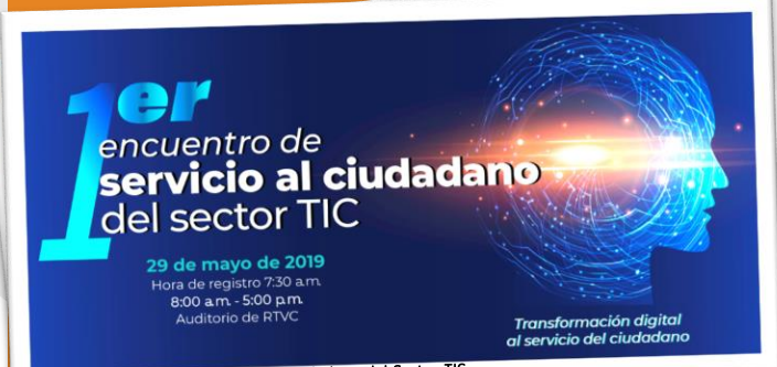
Foto 1er Encuentro del Servicio al Ciudadano del Sector TIC

https://www.kawak.com.co/RTVC/index.php?ref=Z3NOX2RvY3VtZW50YWwvZG9jX3Zpc3VhbG6YXlucGhwP3Y90Tlw