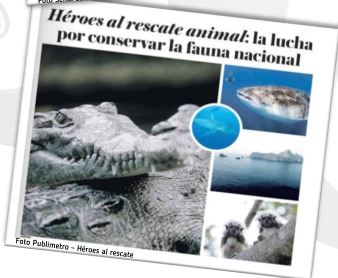
Héroes al rescate