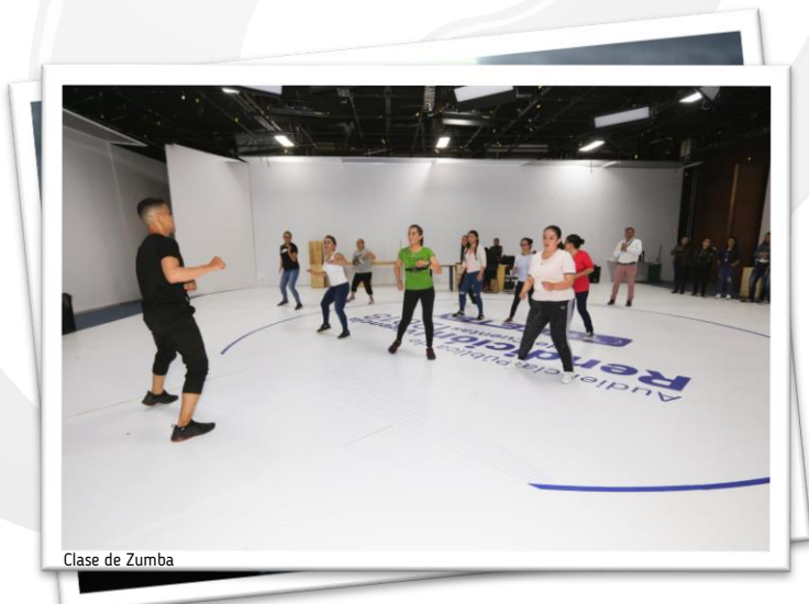
Clase de Zumba